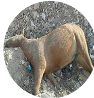
ماء سقط فيه حيوان ميت